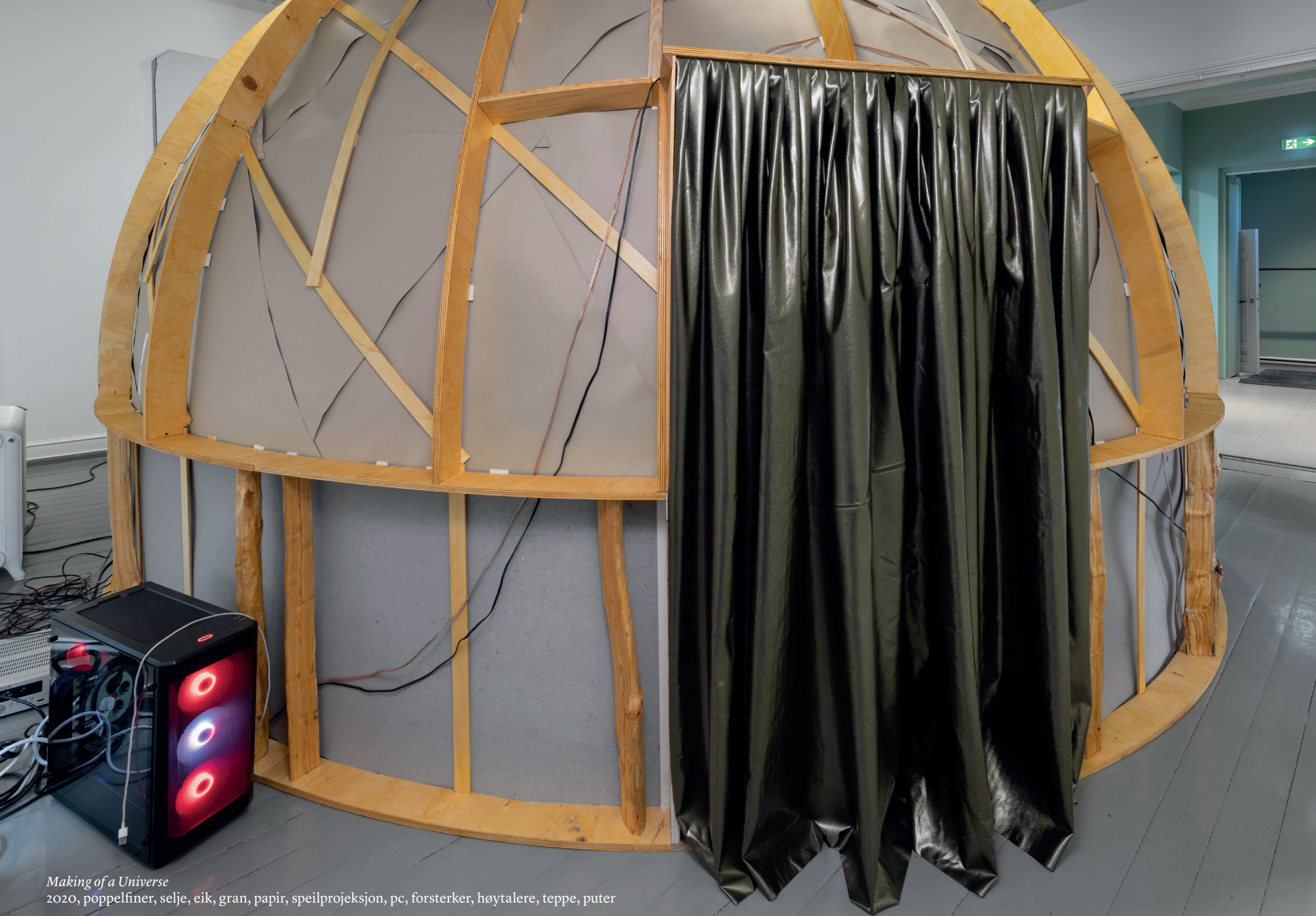
Making of a Universe 2020, poppelfiner, selje, eik, gran, papir, speilprosjeksjon, pc, forsterker, høytalere, teppe, puter