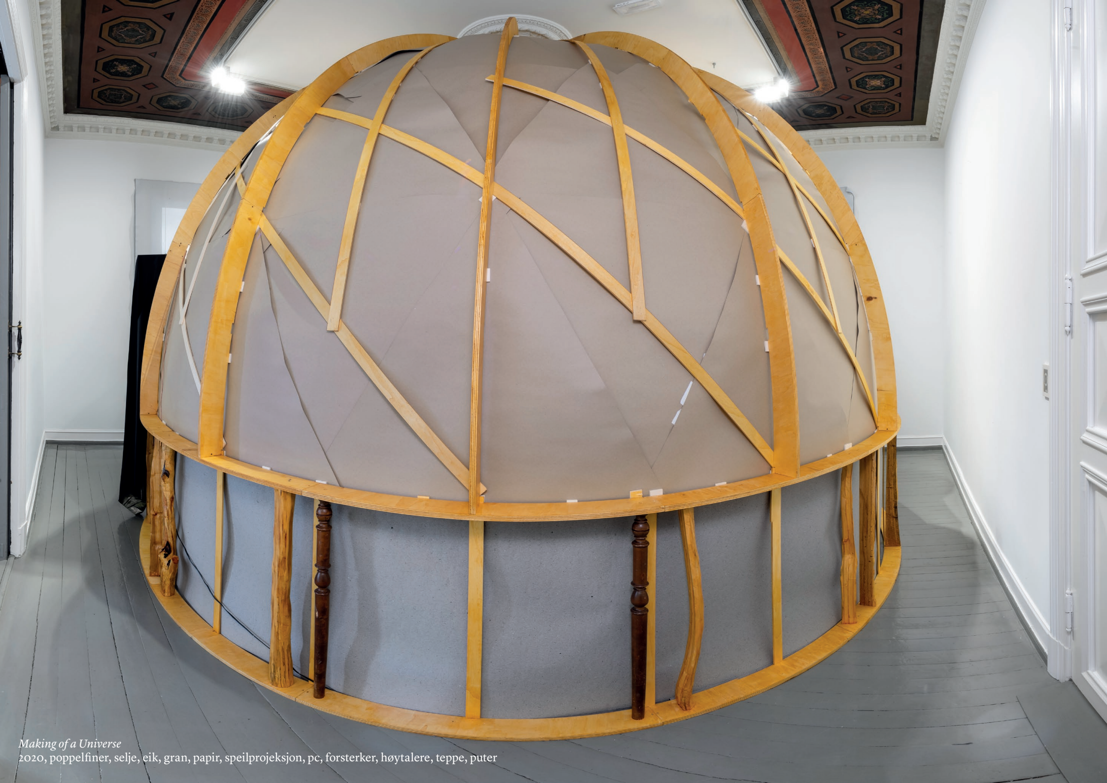
Making of a Universe 2020, poppelfiner, selje, eik, gran, papir, speilprojeksjon, pc, forsterker, høytalere, teppe, puter