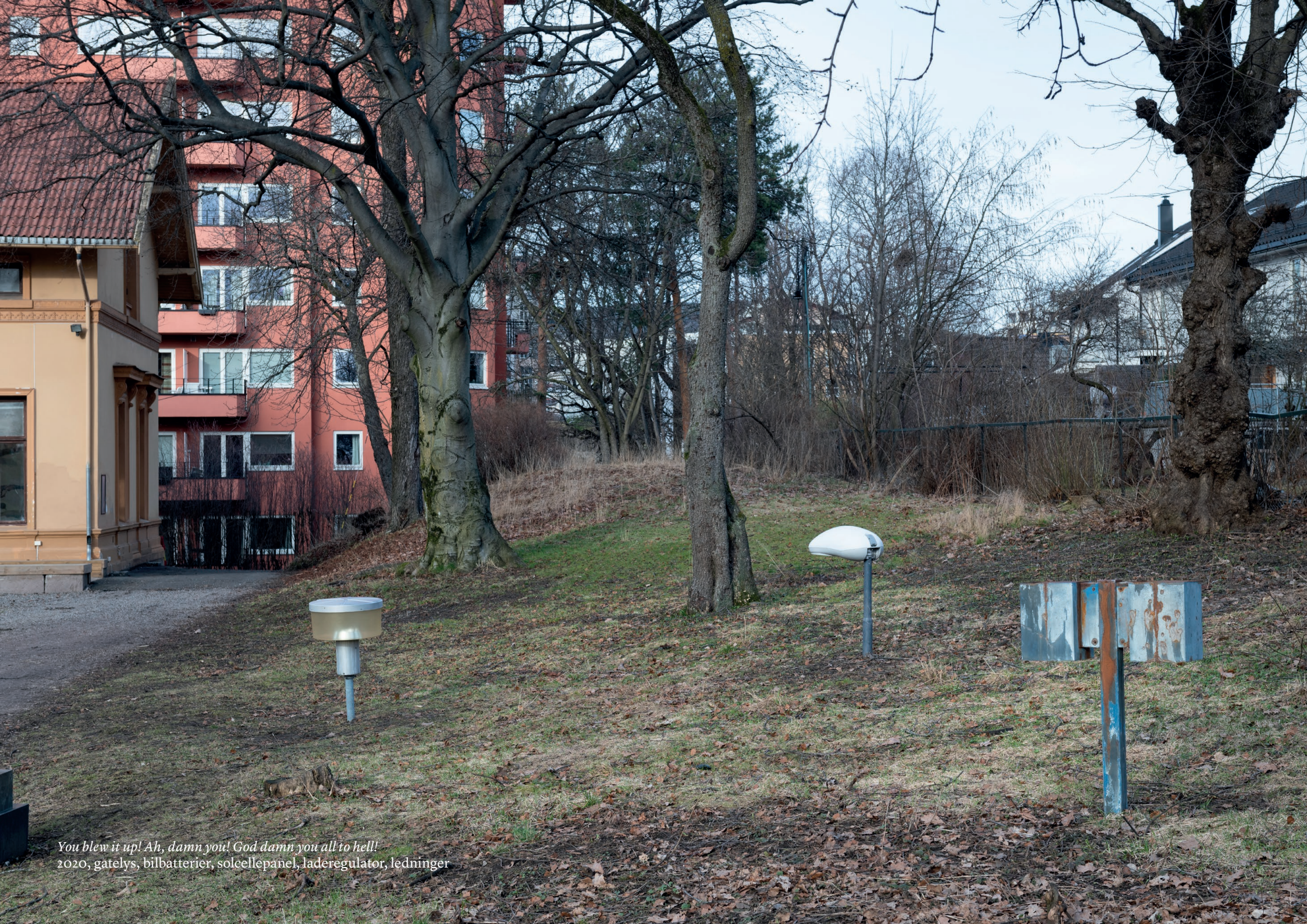
You blew it up! Ah, damn you! God damn you all to hell! 2020, gatelys, bilbatterier, solcallepanel, laderegulator, ledningar