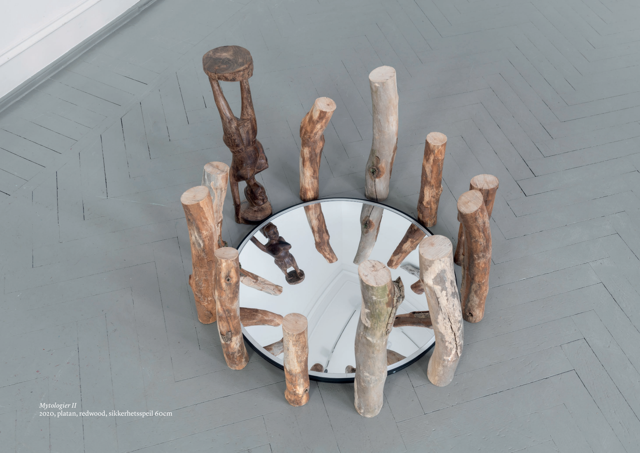
Mytologier II 2020, platan, redwood, sikkerhetsspeil 60cm