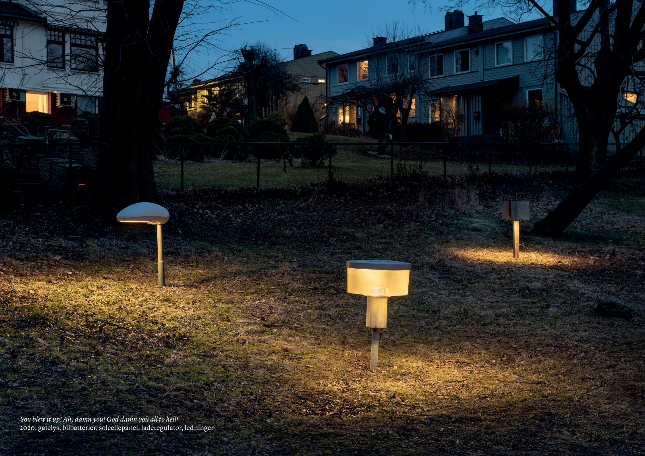
You blew it up! Ah, damn you! God damn you all to hell! 2020, gatelys, bilbatterier, solcellepanel, laderegulator, ledninger