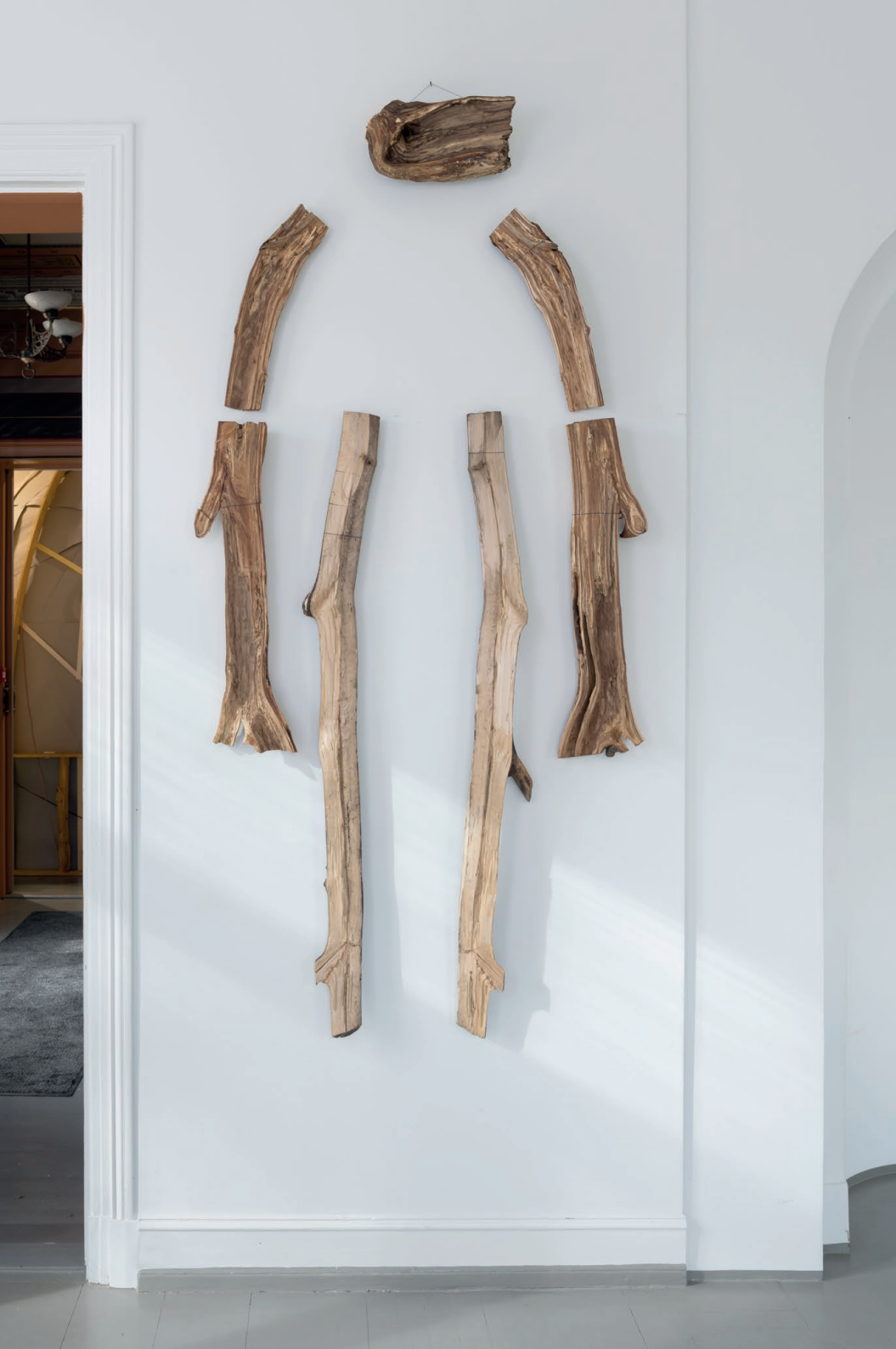
Konstellasjon I 2020, ask, slåpetorn, lønn, gartnertråd